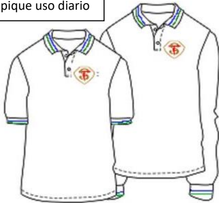
Polera pique uso diario